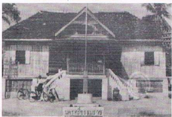
ที่ทำการไปรษณีย์หลังเก่า

แสดงให้เห็นว่าที่เมืองนครศรีธรรมราชมีที่ทำการไปรษณีย์โทรเลขมาก่อน ร.ศ.๑๒๑ (พ.ศ.๒๔๔๕) สมัยที่ผู้เขียนเรียนที่โรงเรียนเบญจมราชูทิศ ทางเหนือของสนามหน้าเมือง เมื่อ พ.ศ.๒๔๙๐ สำนักงานไปรษณีย์โทรเลข นครศรีธรรมราช เป็นอาคาร ๒ ชั้น ตั้งอยู่ตรงข้ามกับบ้านพักของผู้บังคับการตำรวจภูธรนครศรีธรรมราช ถนนราชดำเนิน ด้านหน้ามีบันไดขึ้นลงขวาซ้ายด้านหน้าและถูกรื้อไปเพื่อสร้างอาคารหลังปัจจุบัน