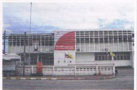
ที่ทำการไปรษณีย์หลังใหม่